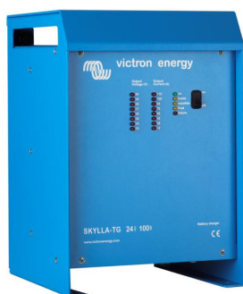
Skylla TG 24 100