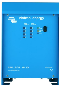
Skylla TG 24 50