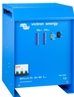
Skylla TG 24 50 3 phase

Para saberlo todo sobre las baterías, las configuraciones posibles y ejemplos de sistemas completos, pida nuestro libro gratuito "Energía Sin Límites" también disponible en www.victronenergy.com