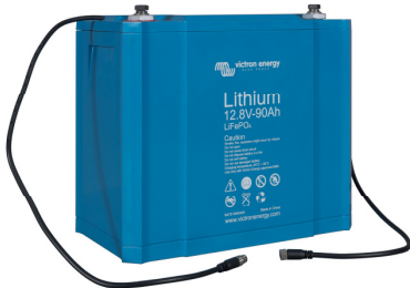
Batería LiFePO4 de 12,8V 90Ah

Nuestro BMS de 12V gestionará hasta 10 batteries en paralelo (las BTV sencillamente se conectan en cadena).