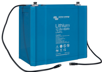
Batería LiFePO4 de 12,8V 60Ah