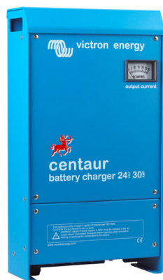
Centaur Battery Charger 24/30