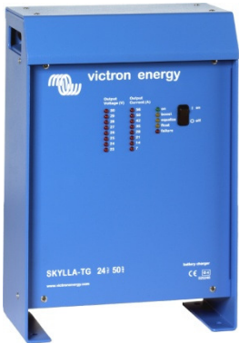
Cargador Skylla 24V 50A

Rango de tensión de entrada universal de entre 90 y 265V CA y también adecuado para alimentación CC Todos los modelos pueden funcionar sin ningún tipo de ajuste con tensiones que van de los 90 a los 265 voltios, ya sea a 50 ó a 60 Hz.