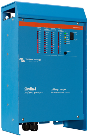
Skylla-i 24/100 (3)