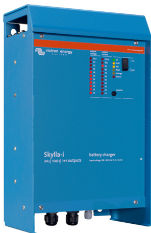
Skylla-i 24/100 (1+1)