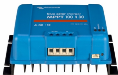
Controlador de carga solar MPPT 100/30