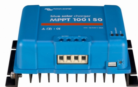
Controlador de carga solar MPPT 100/50