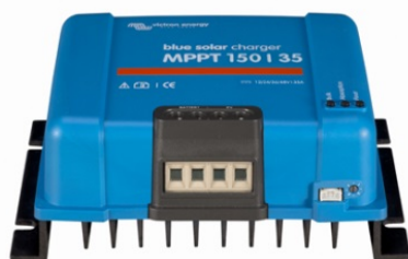
Controlador de carga solar MPPT 150/35