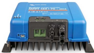
Controlador de carga solar MPPT 150/70-MC4