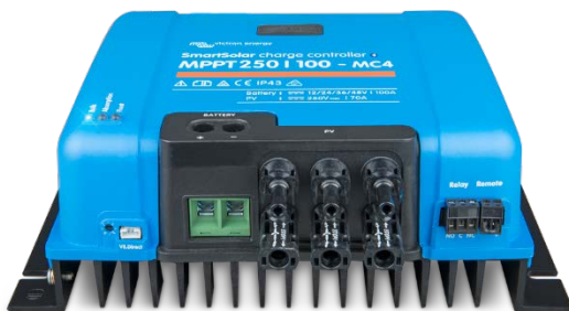
Controlador de carga solar MPPT 250/100-MC4 Sin pantalla