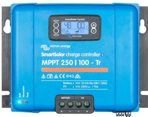
Controlador de carga solar MPPT 250/100-Tr Con dispositivo conectable