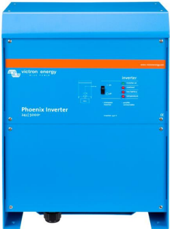
Phoenix Inverter 24/5000