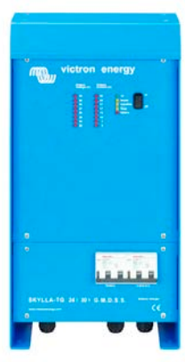
Skylla TG 24 30 GMDSS